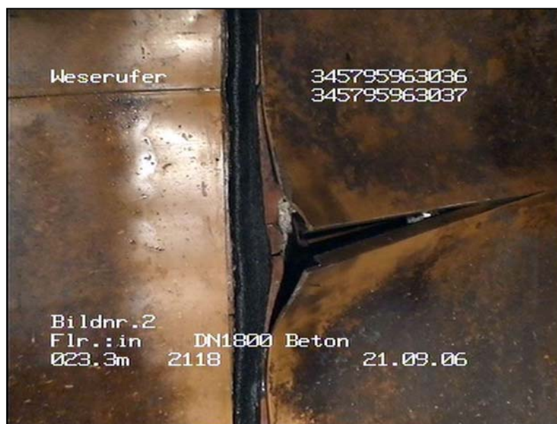
Gestochen scharfe Schadensdetails sind bei der Mindener TV-Inspektion im Großprofil Standard.

Auf dem Deckel der Box nimmt der Inspektionstechniker Platz, der mit einer digitalen Videokamera mit starkem Zoom-Objektiv und Weitwinkelvorsatz ausgerüstet ist. Die Fortbewegung erfolgt durch einen Kollegen, der den Inspekteur auf seinem "Rollstuhl" durch den Untergrund schiebt. Die Konstruktion des Stuhls ist so bemessen, dass der Inspekteur die Kamera ohne große Mühe im Bauwerk zentrieren kann, um axial ausgerichtete Bilder zu liefern. Muffen werden bei der Inspektion ebenso manuell abgeschwenkt wie Schäden oder Stutzen, in die bei Bedarf mit dem Zoom der Kamera hinein gefahren wird. Gerade hier liegt ein entscheidender Vorteil der Mensch-basierten Untersuchung durch einen technisch versierten Inspekteur: Ausleuchtung und Bildperspektive können manuell optimiert werden, so dass in jedem Fall exzellente und aussagekräftige Bilder produziert werden.