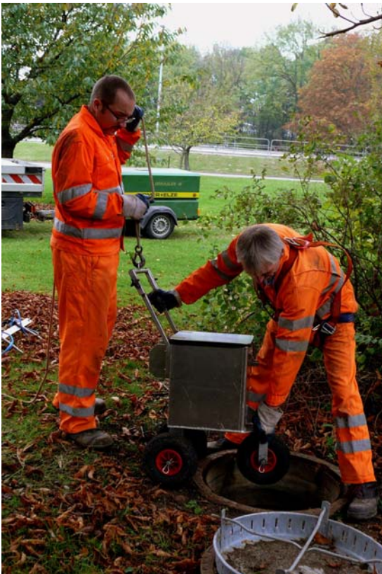
Problemloses Einsetzen des Inspektionssystems über einen Standard-Schacht.

Vor diesem Hintergrund standen 2005 auch die Abwasserbetriebe der Stadt Minden vor der Aufgabe, rund 23 Kilometer begehbare Kreis-, Ei- und Kastenprofile unterschiedlicher Werkstoffe in Nennweiten bis DN 2000 zwecks Vollzug der SÜWVKan schnellst möglich zu inspizieren und zu dokumentieren. In gründlicher Abwägung der verfügbaren technischen Alternativen entschied man sich für eine bemannte Inspektion und die Bildaufzeichnung mit einer Video-Kamera - nicht zuletzt, um die Vorteile einer menschlichen In-Situ-Beurteilung des Rohrzustandes zu nutzen und in die Inspektion einbringen zu können. Dabei galt es, im Ergebnis eine Dokumentation zu generieren, die den Ansprüchen an eine Kamerabefahrung mindestens stand hält, insbesondere hinsichtlich Bildqualität. Zugleich sollte die Inspektion für das Personal ergonomisch möglichst komfortabel erfolgen und den zu berücksichtigenden Aspekten der Arbeitssicherheit genügen.