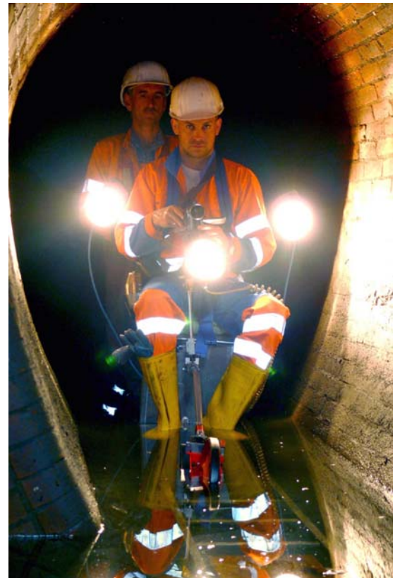
Ein Mitarbeiter der Mindener Stadtentwässerung schiebt die Inspektionseinheit mit seinem filmenden Kollegen durch das Abwasserbauwerk.

Zu diesem Zweck entwickelte die JT elektronik GmbH, Lindau, eine auf Rädern schiebbare Inspektionseinheit, die sich mit wenigen Handgriffen montieren und auch über Standard-schächte DN 1000 in den Abwasserkanal einbringen lässt. Im Prinzip ist das System ein fahrbarer Stuhl, unter dessen Sitzfläche in einer Box mehrere Trockenbatterien Platz finden.